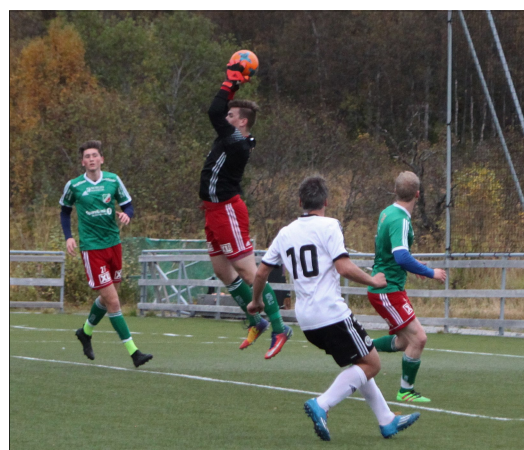
TRUSSEL: Også i første omgang var Soif-veteranen en trussel for Morild-forsvaret.